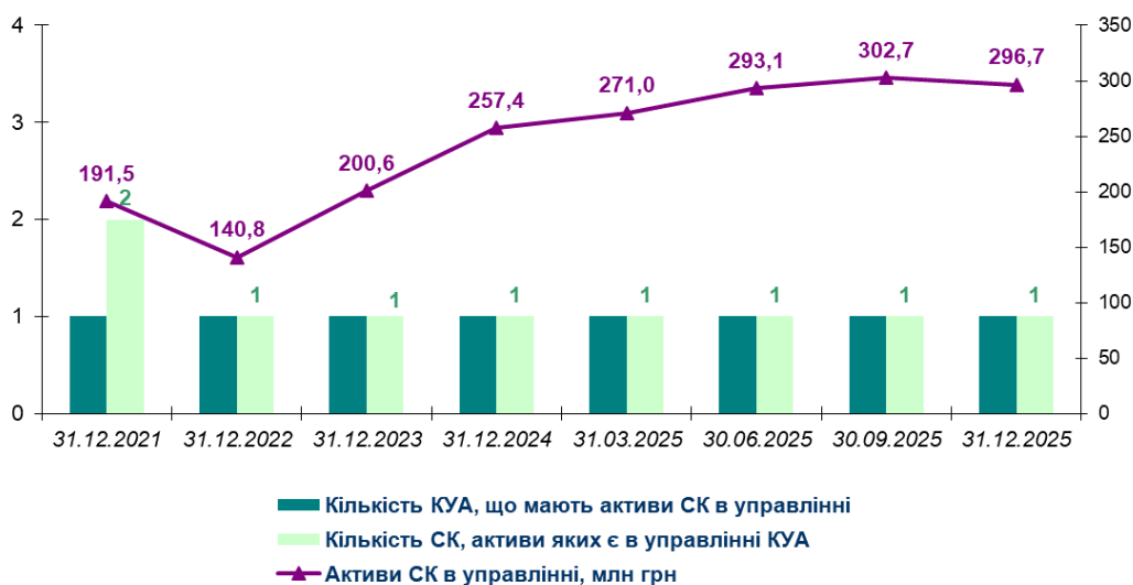
Рис. 1. Динаміка управління активами СК у 2021-25 рр.

Кількість СК , що передали активи в управління КУА, залишалася незмінною: на кінець 2025 року одна КУА мала в управлінні активи однієї СК .