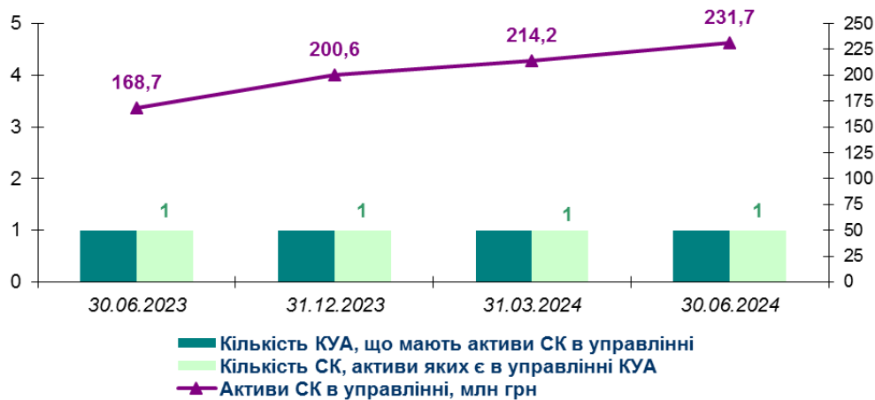
Рис. 1. Динаміка управління активами СК у 2-му кварталі 2023-24 рр.

Кількість СК, що передали активи в управління КУА, залишалася незмінною третій рік поспіль: на кінець червня 2024 року одна КУА мала в управлінні активи однієї СК .