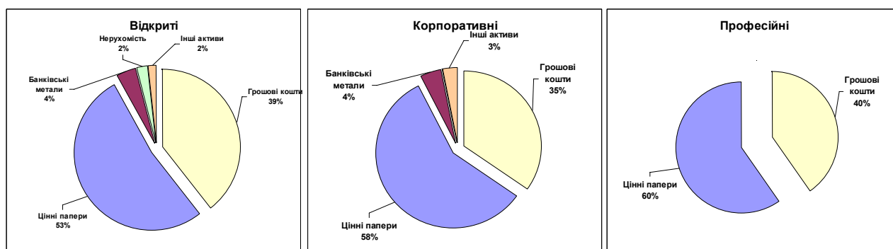
Рис. 3. Структура активів різних видів НПФ станом на 31.03.2008 р.

Такі зміни переважно відбувалися за рахунок відкритих фондів (рис. 3), які поступово зменшували частку своїх грошових коштів та депозитів (-4,1 в.п.) за рахунок придбання цінних паперів (+5,4 в.п.).