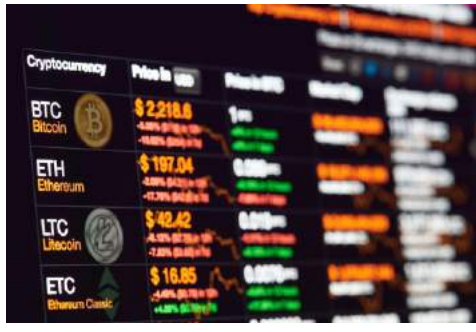
Время ICO вышло