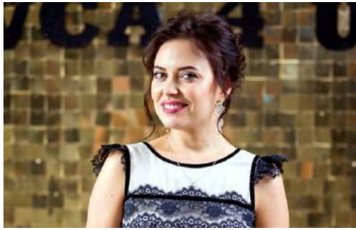
Что ждет украинский инвестиционный рынок в 2019