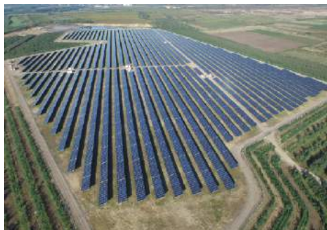
Участки для строительства солнечных станций