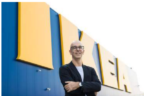
ИКЕА будет развиваться в Украине очень быстро