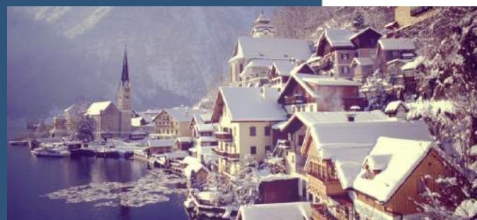
Cushman & Wakefield

Богатые богатеют World Wealth Report 2018: Количество богатей во всем мире неуклонно растет, как и их благосостояние