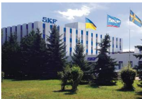
Инвестируем в Украину: SKF (Швеция)