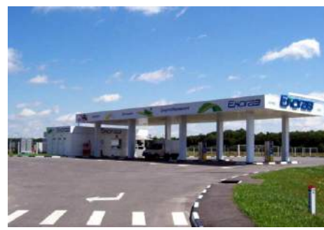
Многотопливный заправочный комплекс с проектом развития